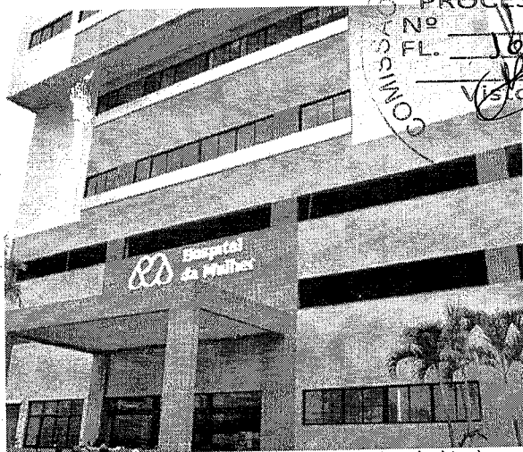
Hospital da Mulher Nise da Silveira conta com 14 ambulatórios, que funcionam das 7h às 21h

No entanto, o que é referenciado no equipamento de saúde são os ambulatórios, ou seja, as consultas são agendadas.