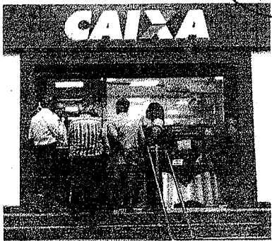
Índice de inadimplência na Caixa encorrou período em queda

As despesas de pessoal aumentaram 6,1%. O lucro líquido alcançou saldo de R$ 715,0 bilhões, crescimento de 4,5% em 12 meses e participação de 22,8% no mercado. 'O crescimento das operações de habitação, saneamento e infraestrutura